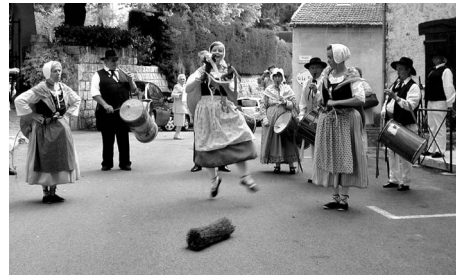
Danse de "La Souche"